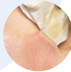
Irritierte, gereizte Haut